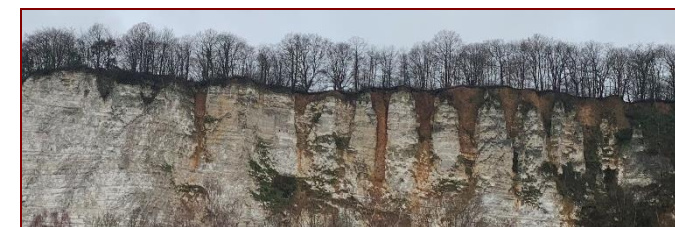
Racines du manteau d'altération – Tancarville - Normandie